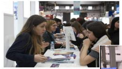
El Saló és el millor lloc per explicar dubtes i aconseguir informació

dos espais amb personal especialitzat de l'Oficina d'Accés a la Universitat (OAU) i de l'Agència de Gestió d'Ajuts Universitaris i de Recerca (AGAUR) dedicats a l'atenció personalitzada dels estudiants i a la celebració de xerrades informatives d'interès per als futurs universitaris.